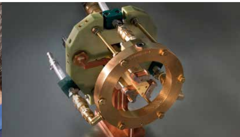
Inductor para el temple de superficies de trípodes. El cabezal del inductor está equipado con concentradores de campo magnético, ducha principal y pantallas de enfriamiento final.