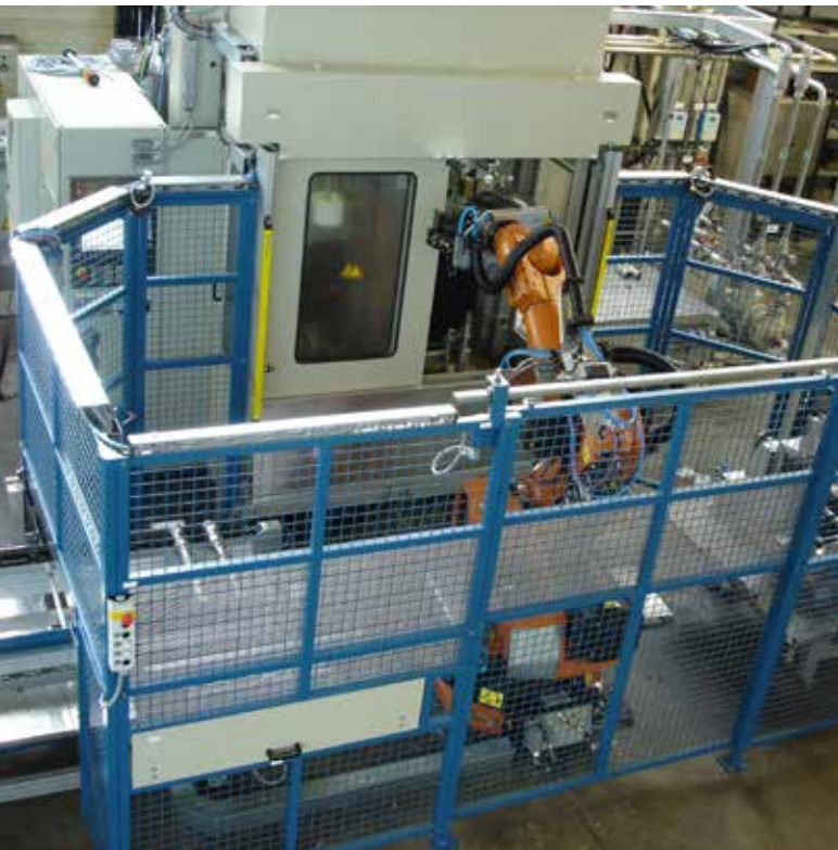
Aumentando la productividad: una máquina de temple vertical EFD Induction con carga y descarga automática.

Hardline de EFD Induction es una familia de sistemas de inducción para tratamiento térmico superficial y localizado de piezas. HardLine incluye desde el suministro de pequeñas máquinas de carga y descarga manual, hasta grandes plantas en versión «llave en mano» para operaciones de mecanizado, lavado, temple, enderezado y revenido.