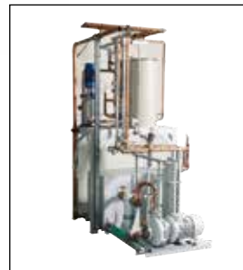
Sistema de refrigeración y enfriamiento