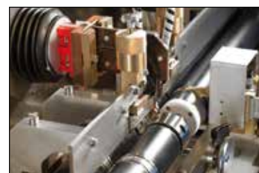
Área de trabajo