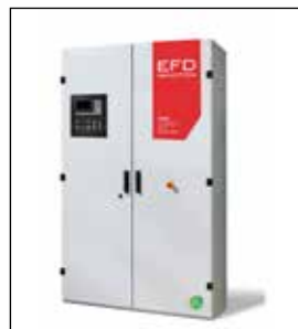
Sinac-Generator für induktive Erwärmung

Die Entwicklung von Sondermaschinen ist eine Spezialität von EFD Induction. Maßgeschneiderte Systeme machen sogar fast die Hälfte unserer Härtemaschinen aus. Unser besonderes Fachgebiet ist die Entwicklung und Herstellung von Geräten für die Laserhärtung sowie von Trommelsystemen. Außerdem entwickeln und liefern wir Anlagen für den Transfer in der Produktionslinie und Fördersysteme für komplexe Bauteile mit mehreren Härte- und Anlasszonen.