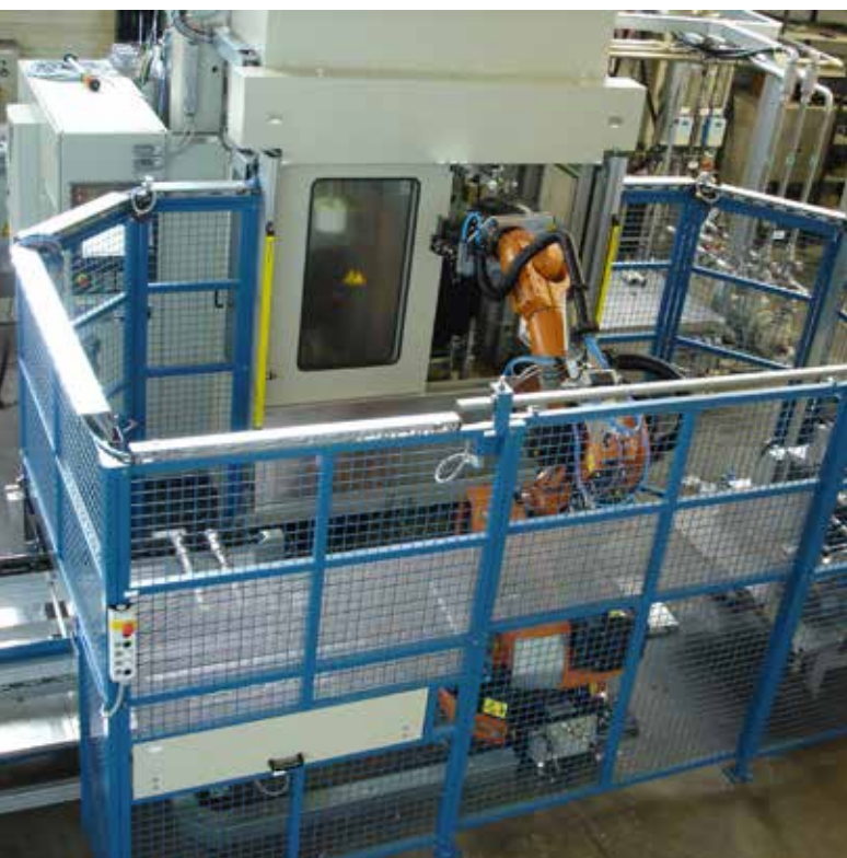
提高生产率:一台自动上/下料的EFD Induction HardLine 立式淬火机床

HardLine是 EFD Induction产品家族中的热处理系统,用于表面和穿透淬火。