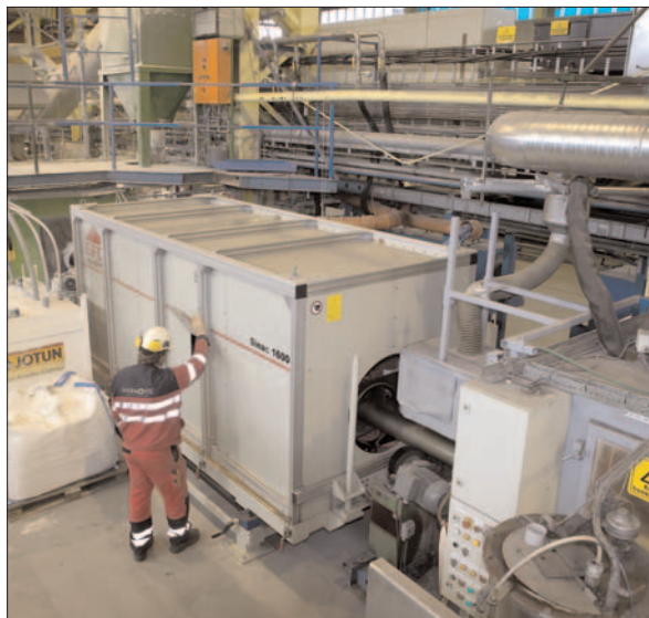
Un Sinac de moyenne fréquence compensé en série, en opération de préchauffage de composants industriels.

Sinac est disponible en standard mais peut aussi répondre à un cahier des charges spécifique. Toutefois, quel que soit votre choix, Sinac contribuera à l'amélioration de la qualité et de la capacité de production ainsi qu'à la réduction des coûts. Pour plus de renseignement, n'hésitez pas à nous contacter dès aujourd'hui. Nos nombreuses références sont là pour vous prouver que Sinac a atteint ces objectifs. Un système Sinac peut avoir un grand impact sur votre activité en voici quelques exemples.