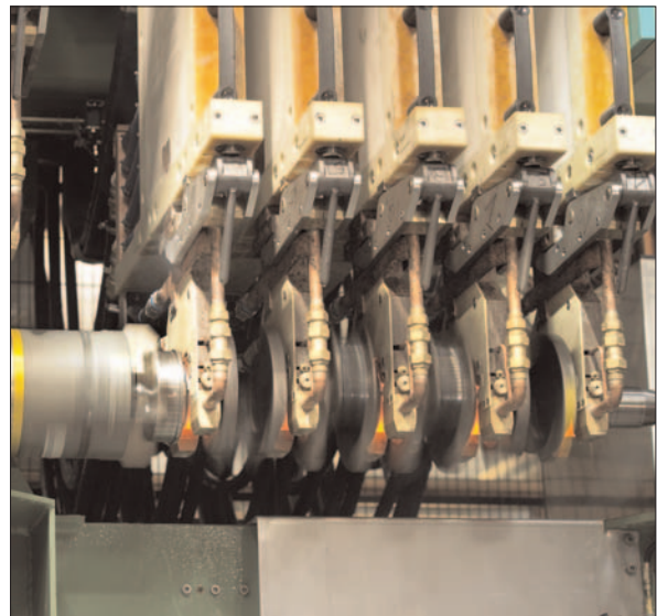
Parfait pour les travaux les plus lourds ; Sinac dans un système de traitement thermique de vilebrequin.