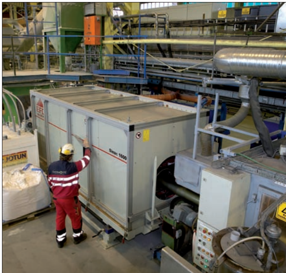
Serienkompensierter, mittelfrequenter Sinac beim Vorwärmen industrieller Teile.

Sinac ist als Standardprodukt oder als maßgeschneidertes System erhältlich. Aber für welches System Sie sich auch entscheiden, Sinac hilft Ihnen, die Qualität zu steigern, die Produktivität zu erhöhen und die Kosten zu senken. Falls Sie weitere Informationen benötigen, rufen Sie uns doch heute noch an. Unsere Referenzliste enthält viele Beispiele, die dies belegen. Ein Sinac-System kann großen Einfluss auf Ihre Geschäfte haben. Wir möchten Ihnen gerne zeigen wie.